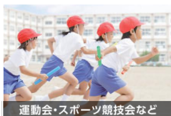
運動会・スポーツ競技会など