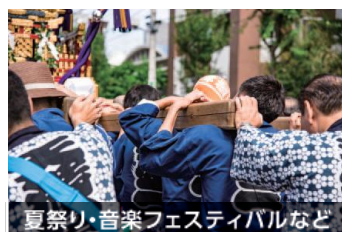
夏祭り・音楽フェスティバルなど