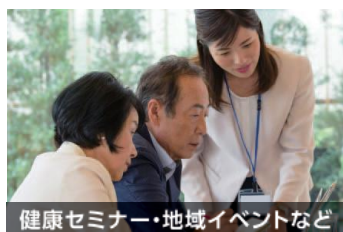
健康セミナー・地域イベントなど